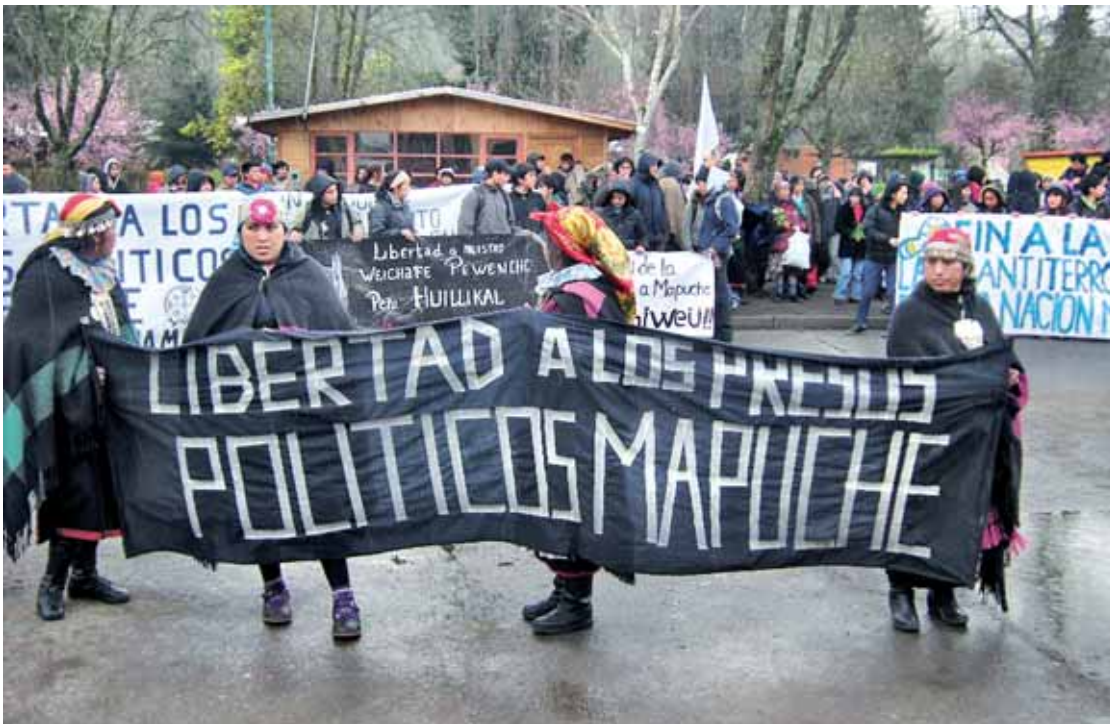
Marxa organitzada a la presó de Temuco el 18 d'agost d'enguany

El calendari de mobilitzacions prèvies tindrà les cites més destacades el 15, el 18 i el 25 de setembre. S'organitzen desenes de comitès a barris i pobles